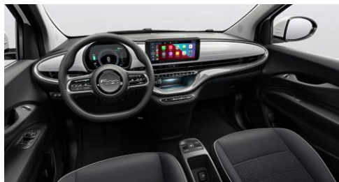
SVART, MED INSTRUMENTBRÄDA LACKAD I SVART (573)