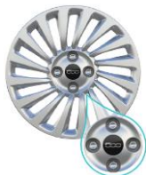
15" STÅLFÄLGAR (NAVKAPSLAR)