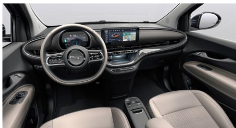
PREMIUM WHITE SOFT TOUCH (845) SE FÄRGMATRIS FÖR CABRIOLET