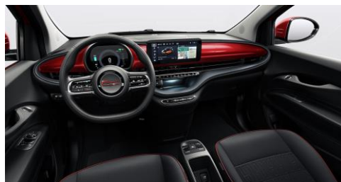
SVART, MED INSTRUMENTBRÄDA LACKAD I RÖD FÄRG (330)