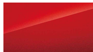
Parkour Red (röd)