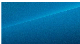
Surfing Blue (blå)