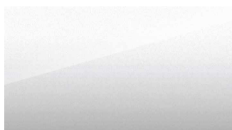
Skiing White (vit)