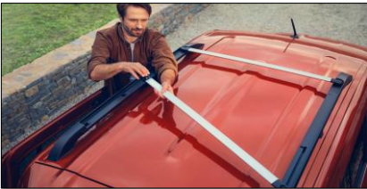
Smarta takräcken. Förvandla lätt från längsgående till tvärgående