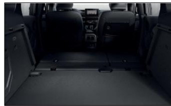
Fäll baksätet och få helt plan lastyta