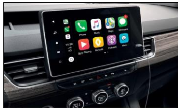
Easy link 8" med Apple Carplay eller Android Auto