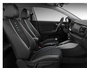
Svart interiör med svart delläderklädsel (konstläder) (GT Line)