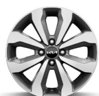
16 " aluminiumfälg (Advance)