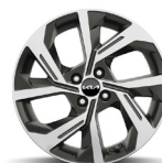
17 " aluminiumfälg (GT Line)