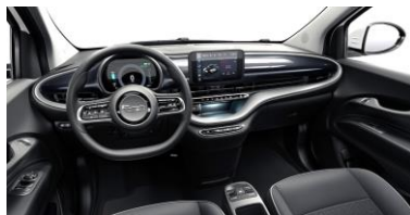
SVART, MED INSTRUMENTBRÄDA LACKAD I SVART (702)