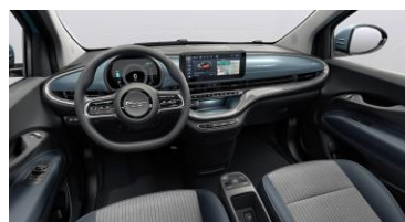
GRÅ ICE, MED INSTRUMENTBRÄDA LACKAD I EXTERIÖRFÄRG (641) SE FÄRGMATRIS FÖR CABRIOLET