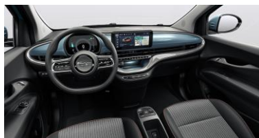
SVART, MED INSTRUMENTBRÄDA LACKAD I EXTERIÖRFÄRG (099) SE FÄRGMATRIS FÖR CABRIOLET