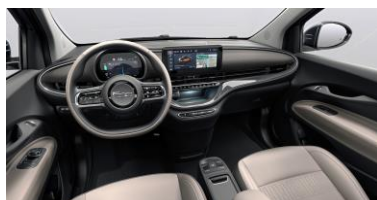
PREMIUM WHITE SOFT TOUCH (845) SE FÄRGMATRIS FÖR CABRIOLET