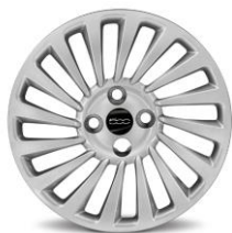
15" STÅLFÄLGAR (NAVKAPSLAR)