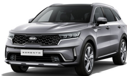
Steel Grey (KLG) metallic