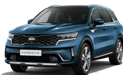
Mineral Blue (M4B) metallic