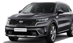
Platinum Graphite (ABT) metallic