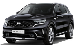
Aurora Black Pearl (ABP) metallic pearleffekt