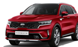
Runway Red (CR5) metallic