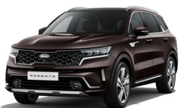
Essence Brown (BE2) metallic