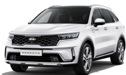
Snow White Pearl (SWP) metallic pearleffekt