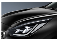
Aurora Black Pearl (ABP) metallic (pearleffekt)