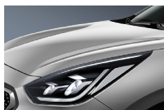
Silky Silver (4SS) metallic