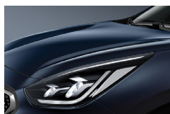
Gravity Blue (B4U) metallic