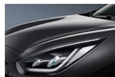
Interstellar Grey (AGT) metallic