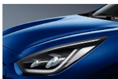
Yacht Blue (DU3) metallic