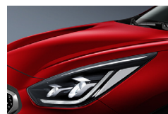
Runway Red (CR5) metallic