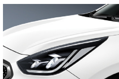
Snow White Pearl (SWP) metallic (pearleffekt)