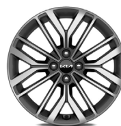
17 " aluminiumfälg (GT Line)