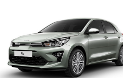
Urban Green (URG) metallic (pearleffekt)

Kia Sweden AB Kanalvägen 10A 194 61 Upplands Väsby Sverige Tfn: 08 - 400 443 00 www.kia.com