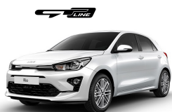
Clear White (UD) solid