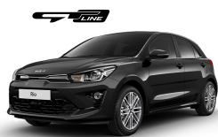
Aurora Black Pearl (ABP) metallic (pearleffekt)