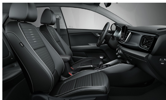
Svart interiör med svart delläder och grå kontrast-sömmar (konstläder). Instrumentpanel: detaljer i kolfiberfinish (GT Line)