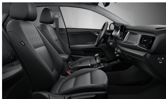
Svart interiör med svart tygklädsel (Advance)