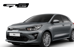
Perennial Gray (PRG) metallic (pearleffekt)