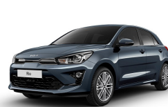
Smoke Blue (EU3) metallic (pearleffekt)