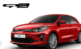
Signal Red (BEG) metallic (pearleffekt)