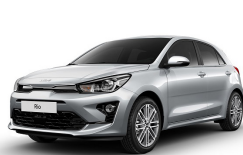
Silky Silver (4SS) metallic