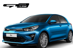
Sporty Blue (SPB) metallic (pearleffekt)