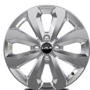
16 " aluminiumfälg (Advance)