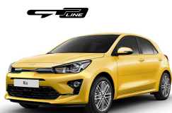
Most Yellow (MYW) metallic (pearleffekt)