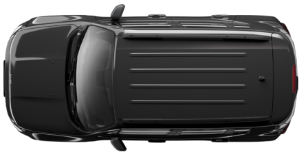
Granite Crystal Metallic