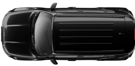
Carbon Black Metallic