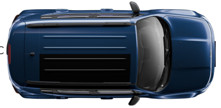
Jetset Blue Metallic