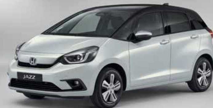
PREMIUM SUNLIGHT WHITE PEARL / TWO-TONE