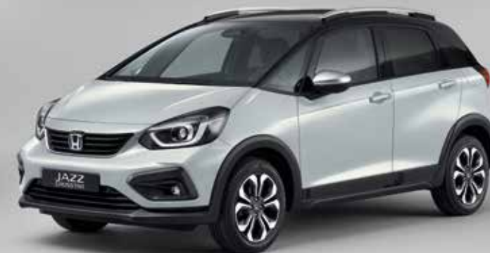
PREMIUM SUNLIGHT WHITE PEARL / TWO-TONE