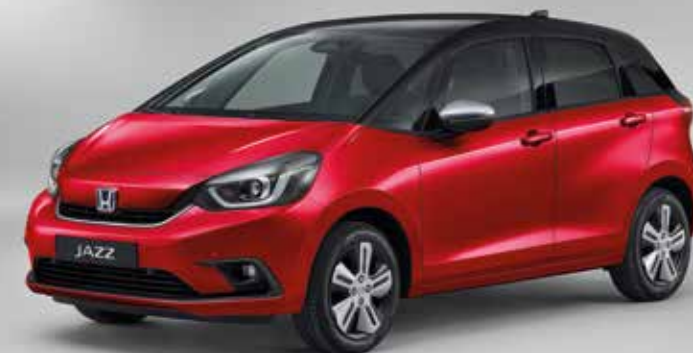
PREMIUM CRYSTAL RED METALLIC / TWO-TONE