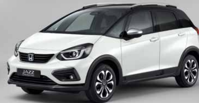
PLATINUM WHITE PEARL / TWO-TONE