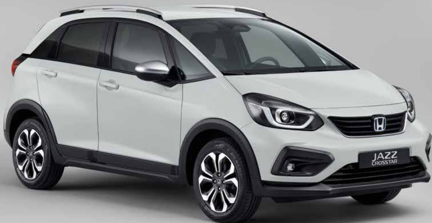
TAFFETA WHITE III

Nya Jazz Crosstar finns i snygga tvåfärgade och enkelfärgade alternativ som drar blicken till sig. Den erbjuds bland annat i en exklusiv Surf Blue. Sätena är stoppade i bekvämt men tåligt vattenavvisande tyg, vilket bidrar till att interiören ser ren och snygg ut, vart du än kör.