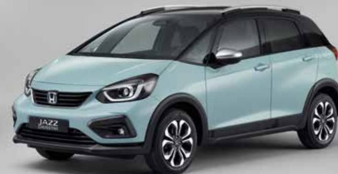
SURF BLUE / TWO-TONE