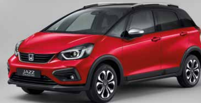
PREMIUM CRYSTAL RED METALLIC / TWO-TONE

Modellen som visas är Jazz Crosstar 1.5 i-MMD Executive. Surf Blue och urvalet av tvåfärgade alternativ erbjuds endast för JazzCrosstar.