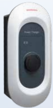
Honda Power Charger S+