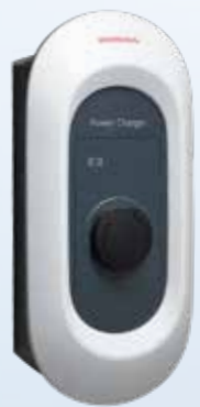
Honda Power Charger S