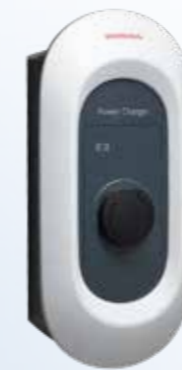
Honda Power Charger S