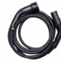
5 X Mode 3-Laddningskablar