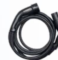
Mode 3- Laddningskabel