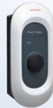
Honda Power Charger S+