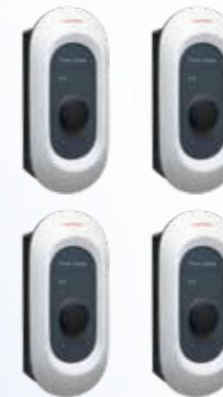
4 x Honda power charger S