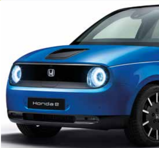
PREMIUM CRYSTAL BLUE METALLIC