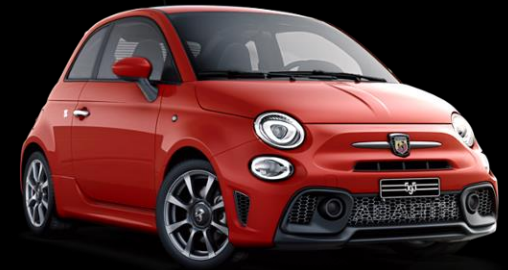
RÖD, ABARTH (176)

FINNS ÄVEN SOM BI-COLOR MED SVART TAK (890)