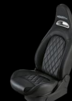
SVARTA SPORTSTOLAR, LÄDERKLÄDSEL