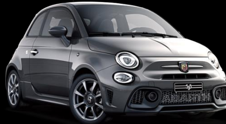
MÖRKGRÅ, RECORD (695)

FINNS ÄVEN SOM BI-COLOR MED SVART TAK (883)