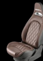
BRUNA SPORTSTOLAR, "HELMET BROWN" LÄDERKLÄDSEL