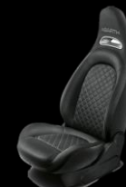
SVARTA SPORTSTOLAR, TYGKLÄDSEL