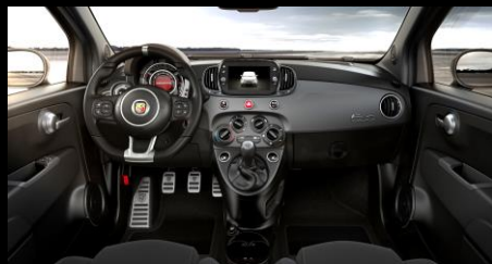
SVART MED MATTLACKAD INSTRUMENTBRÄDA