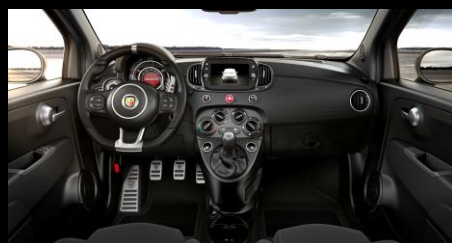
SVART MED MATTLACKAD INSTRUMENTBRÄDA