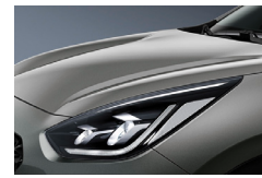
Steel Grey (KLG) metallic