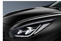
Aurora Black Pearl (ABP) metallic (pearleffekt)