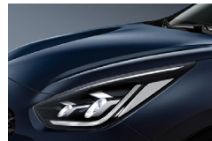
Gravity Blue (B4U) metallic