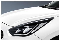
Snow White Pearl (SWP) metallic (pearleffekt)