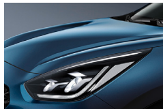
Deep Cerulean Blue (C3U) metallic