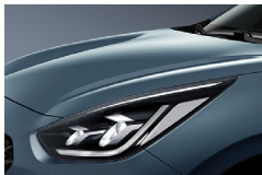
Horizon Blue (BBL) metallic