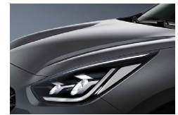
Platinum Graphite (ABT) metallic