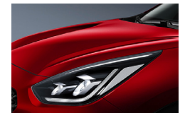
Runway Red (CR5) metallic