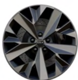
18" aluminiumfälg (Hybrid GT Line)