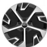
18" aluminiumfälg (Hybrid Action & Advance)