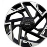
19" aluminiumfälg (Plug-in Hybrid GT Line)