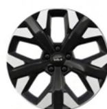
19" aluminiumfälg (Plug-in Hybrid Action & Advance)